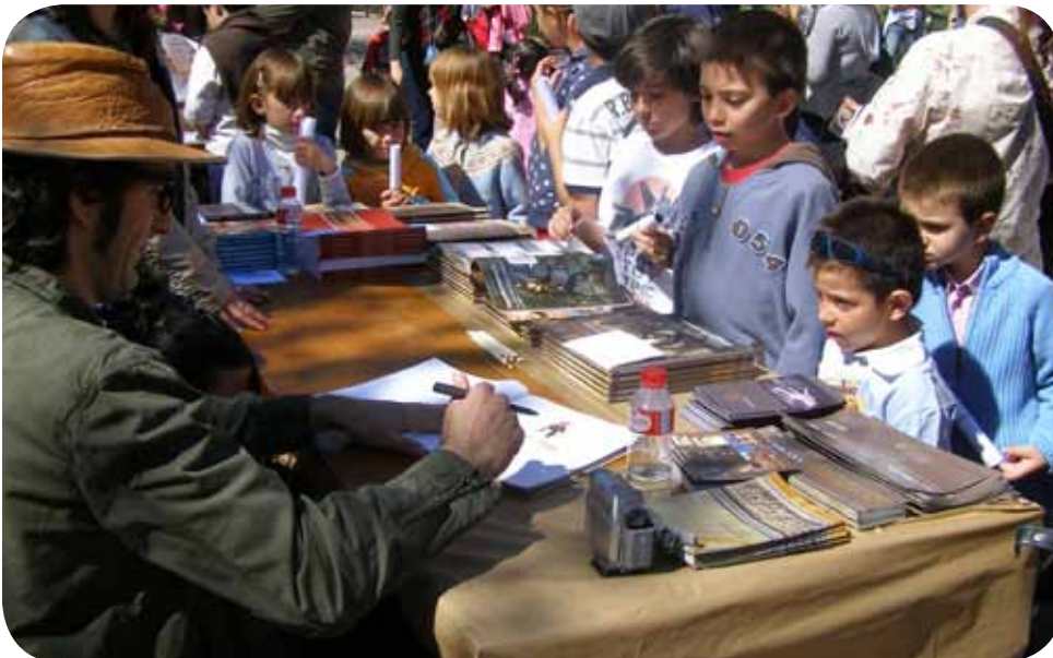
Presentación de “Turiaso Jones” en la Feria del Libro de Tarazona.