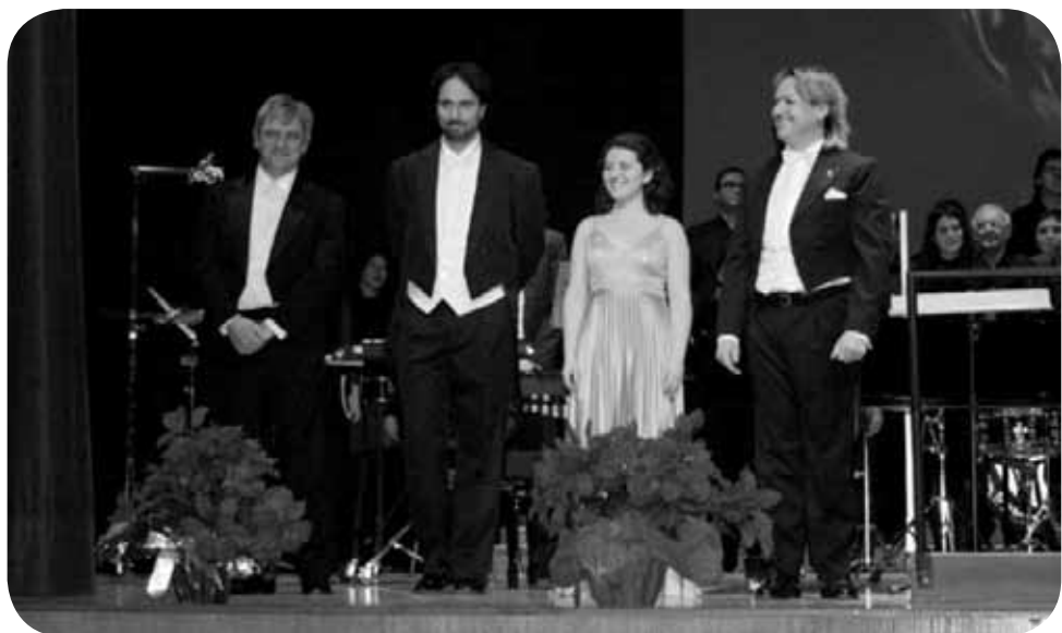
Carmina Burana. . Camerata Lírica de España.