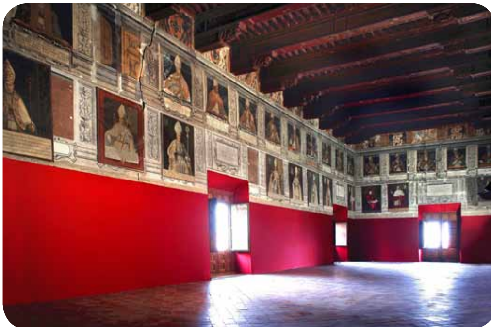
Salón de Obispos del Palacio Episcopal.

Esta sala alberga un alfarje mudéjar realizado entre 1441 y 1442 y las pinturas murales de todos los obispos que han pasado por la Diócesis de Tarazona desde 1556. Los primeros retratos fueron obra de Pietro Morone y tienen su precedente en la serie de papas pintada en la Capilla Sixtina a finales del Cuatrocientos. Actualmente, el avanzado estado de deterioro de su cubierta causa filtraciones y pone en peligro la conservación de la estructura del Salón de Obispos y sus pinturas. Es un espacio que se puede visitar y, durante 2010, se continuará incluyendo en la ruta guiada de Tarazona Monumental en la medida que las obras lo permitan.