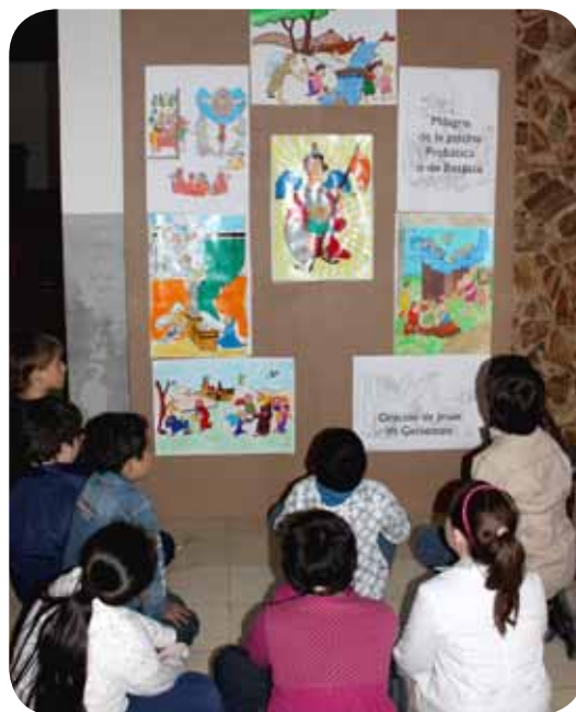
Taller didáctico para niños sobre el retablo mayor de San Miguel.