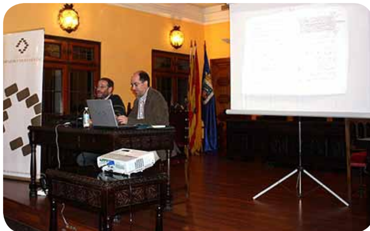
Conferencia del ciclo “El despertar del barrio judío”.