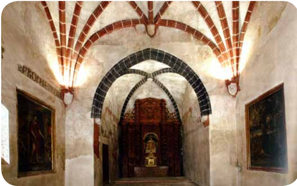
Claustro del ex convento de San Francisco.

Proyecto de interpretación del claustro de San Francisco de Asís.