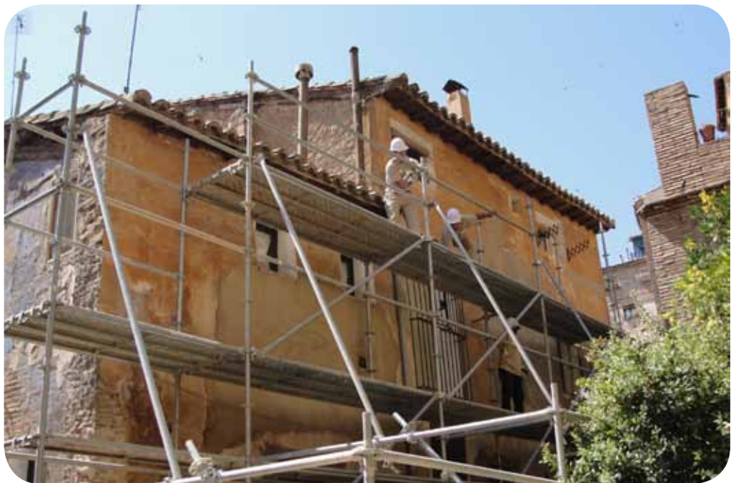
Taller de empleo Judería I.

El origen de este taller se debió a la necesidad de saneamiento y reparación cosmética de la parte pública de la calle de la Judería, al ser una vía localizada en pleno circuito turístico de Tarazona y encontrarse en grave estado de deterioro. En esta calle, que comunica la iglesia de Santa María Magdalena con el Palacio Episcopal y el Ayuntamiento, se localizan las emblemáticas Casas Colgadas. Además, el taller tiene una clara intención de formación, por la que, con la ayuda económica del INAEM y del Fondo Social Europeo, se enseña un oficio a sus integrantes para que lo puedan desarrollar en el futuro.