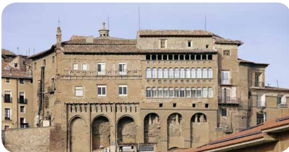
Fachada lateral del Palacio Episcopal.

Pero si por algo se caracteriza Tarazona es por la cantidad de edificios históricos que alberga, entre los que destacan la Catedral, de estilo gótico-mudéjar (se espera su pronta reapertura tras una restauración que se ha prolongado tres décadas) y el Palacio Episcopal (que antes fue Zuda y Palacio Real). La Catedral fue declarada Bien de Interés Cultural en 2002.