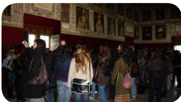
Visita guiada al Salón de Obispos del Palacio Episcopal.

La novedad de 2010 es la inclusión de una ruta temática al mes, en la que se conoce la ciudad en una visita organizada en torno a un único asunto.