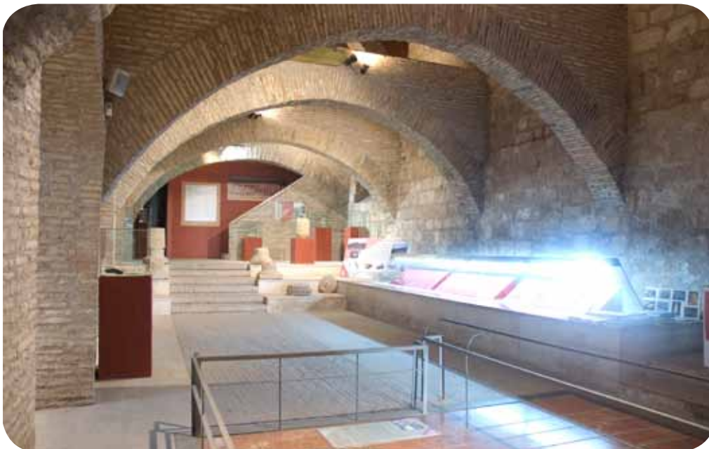
Exposición permanente “Arqueología del Moncayo”.

Además, las sinergias con el Centro de Estudios Turiasonenses permiten disponer de la muestra “Arqueología del Moncayo” (situada permanentemente en los Bajos del Palacio Episcopal).