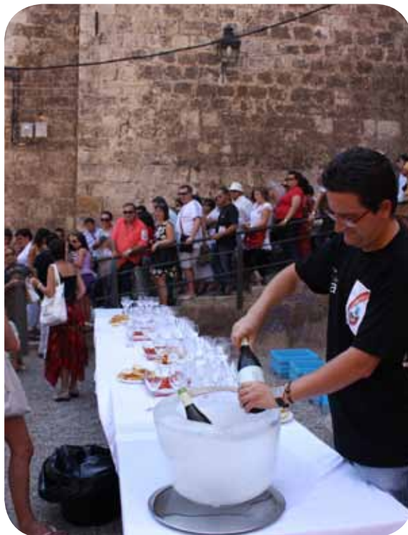
“Cata con arte” en agosto de 2009.