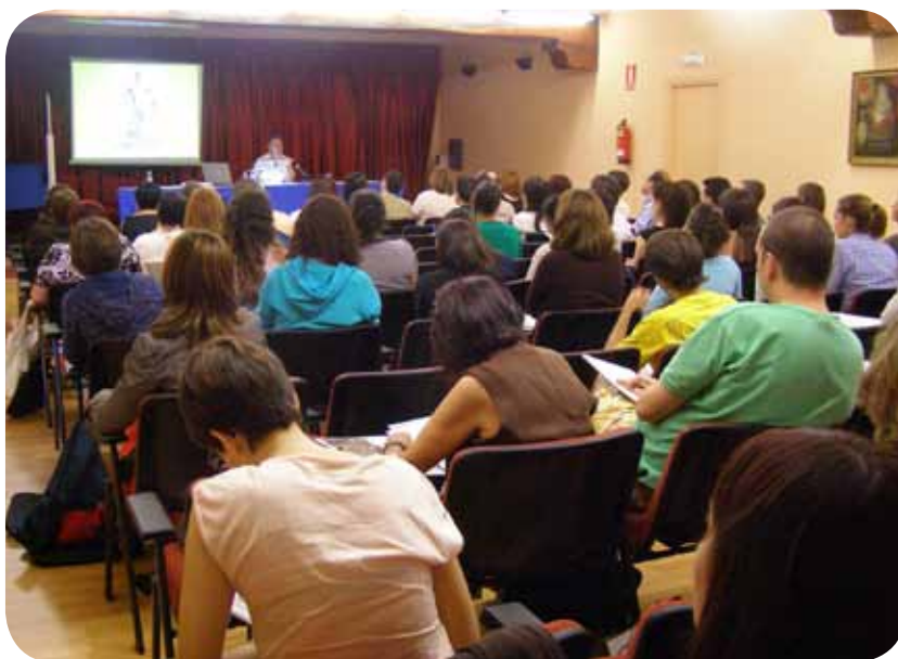
Sesión del curso de verano “Discursos en torno al cuerpo en la Edad Media y el Renacimiento”.