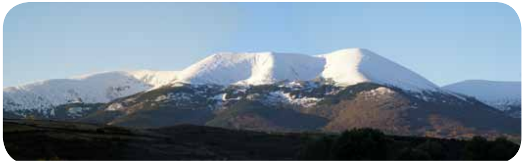
Vista panorámica del Moncayo (Sistema Ibérico, 2.314 metros).

Por ello, el trabajo de la Fundación se centra en la promoción turística y cultural de Tarazona a través de la restauración y difusión de su patrimonio cultural, primer paso de un largo camino que todos los miembros del patronato consideran necesario para revitalizar Tarazona como destino turístico no estacional.