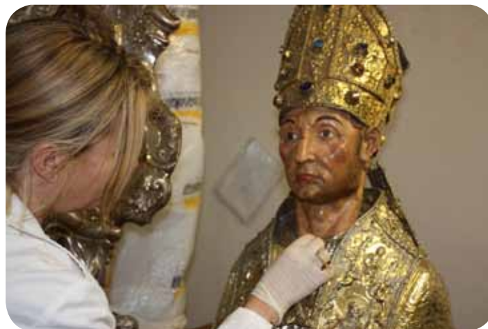
Restauración del busto relicario de San Gaudioso para la exposición “Milenio”.