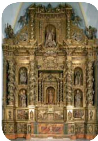
Retablos mayores de San Miguel Arcángel y de la Virgen del Río.