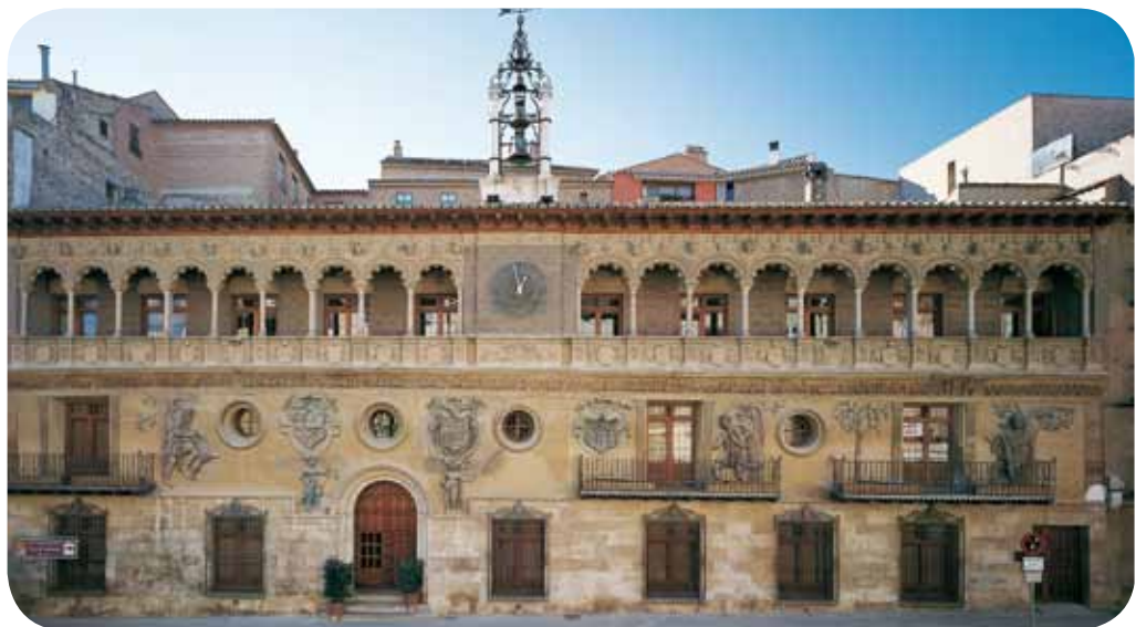
Fachada del Ayuntamiento de Tarazona.

También cabe destacar la rica fachada del Ayuntamiento, cuyo elaborado friso (siglo XVI) representa la entrada triunfal en Bolonia del rey de España Carlos I tras ser coronado como emperador del Sacro Imperio Romano Germánico (1530), y la denominada Plaza de Toros Vieja (1790), de las pocas octogonales que quedan en España. Ambos monumentos fueron catalogados como Bienes de Interés Cultural en 2001.