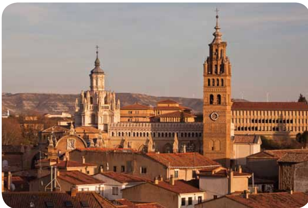
Catedral de Nuestra Señora de la Huerta

La Fundación Tarazona Monumental ( www.tarazonamonumental.es ) es una entidad privada sin ánimo de lucro constituida en 2007 por el Gobierno de Aragón, la Diputación Provincial de Zaragoza, la Caja de Ahorros de la Inmaculada, el Obispado de la Diócesis de Tarazona, el Cabildo Catedral de Tarazona y el Ayuntamiento de Tarazona con el fin de recuperar el rico patrimonio cultural de Tarazona, conservarlo y difundir su valor para poder gestionar una óptima promoción turística y cultural.