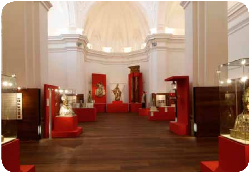
Exposición “Milenio. San Atilano y Tarazona (1009-2009).”